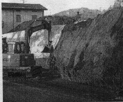
IN DIBATTITO La zona del sinistro, subito dopo il crollo del muro di contenimento.